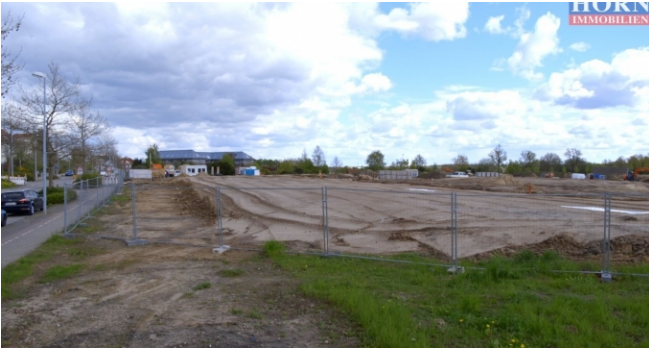
Neubrandenburg Lindenberg Süd